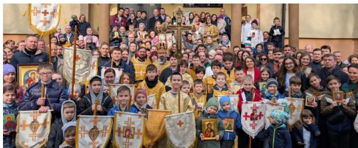
Niedziela Triumfu Ortodoksji w naszej parafii 2025 r.