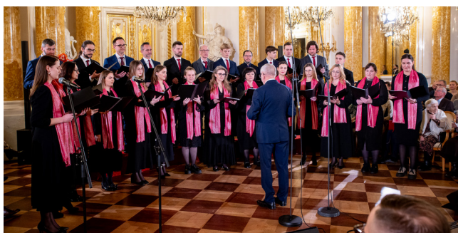
Chór Parafii Prawosławnej Św. Jana Klimaka na Woli w Warszawie