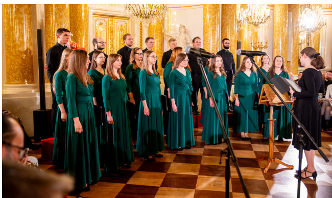
Chór "Mus Arietes" Parafii Rzymskokatolickiej Wszystkich Świętych w Warszawie