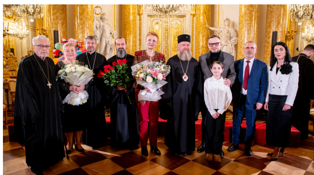
Pamiątkowe zdjęcie czcigodnych gości z organizatorami