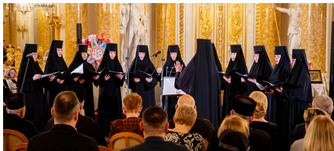
Chór Żeńskiego Monasteru św. Mikołaja w Gródku (Ukraina).