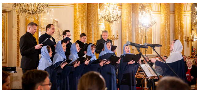
Katedralny Chór Soboru Zaśnięcia Najświętszej Marii Panny w Wilnie (Litwa)